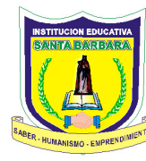
IE Santa Bárbara