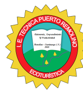
IE Puerto Remolino