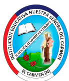
IE NS del Carmen