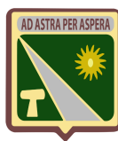
IE San Francisco de Asís